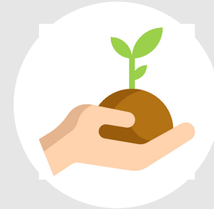
Entstehung von Freiräumen

Die gemeinsame Zukunft ist abhängig von der Fähigkeit, effiziente Strukturen zu schaffen und die notwendige Kommunikation mit dem Einzelhandel auf qualitative Beratung zu konzentrieren. Die Abwicklung der einfachen Auftragserfassung beim Großhandel sollte automatisch geschehen. Der hierzu notwendige permanente Datenaustausch zwischen Bio-Laden und Großhandel erfordert immer wieder ein gewisses Eingreifen. Hinzu kommt die zunehmende Bedeutung der Datenqualität und die Zusammenarbeit bei umfassenden Datenänderungen.