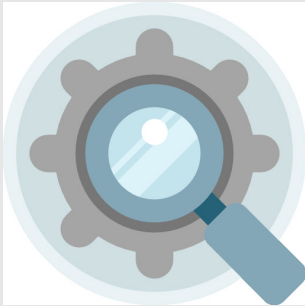
Optimierung der Abläufe